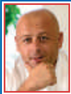
Thierry Marx Chef of the year 2006, 2 Michelin stars in Cordeillan-Bages Chef des Jahres 2006, 2 Michelin-Sterne in Cordeillan-Bages

Passionsfrucht-emulsion und knusprige ivoire-glasur