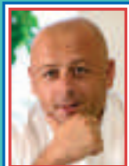
Thierry Marx Chef de l'année 2006, 2 étoiles Michelin à Cordeillan-Bages Chef del año 2006, 2 estrellas Michelin en Cordeillan-Bages